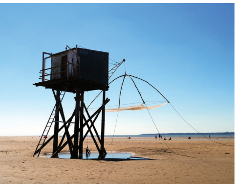
8 km de plages de sable fin

Elle séduit aussi grâce à ses nombreux atouts : Huit kilomètres de plages de sable fin, de paysages dunaires bordés de pins, de mimosas... Les plages de Saint-Brevin-les-Pins vous offrent tout un bouquet de sensations, du farniente estival aux vibrations des sports nautiques et de la glisse pratiquée à l'envie sur des spots dédiés. La destination rêvée de nombreuses balades à pied ou à vélo.