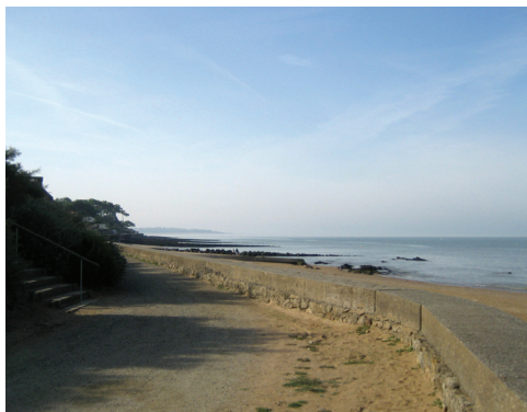
Sentiers côtiers préservés